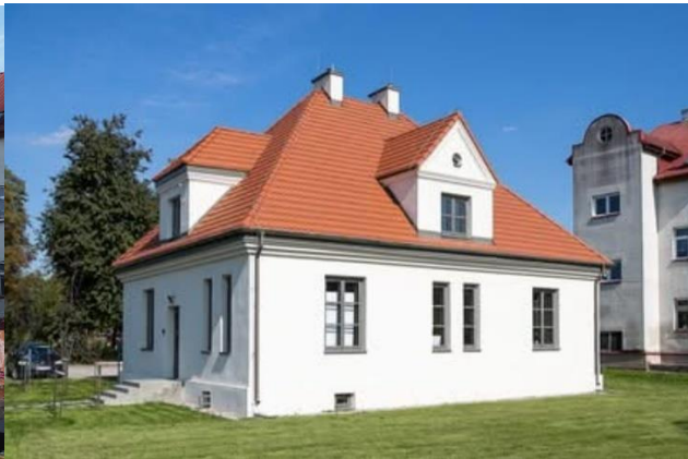
Zdjęcie nr 6. Dom nauczyciela, ul. Staszica 1A, Nasielsk (po przebudowie)