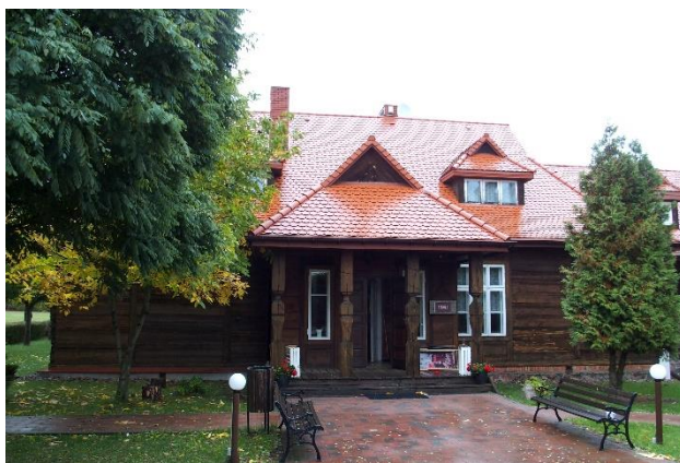
Zdjęcia nr 21, 22. Budynek szkoły w Krzyczkach Szumnych