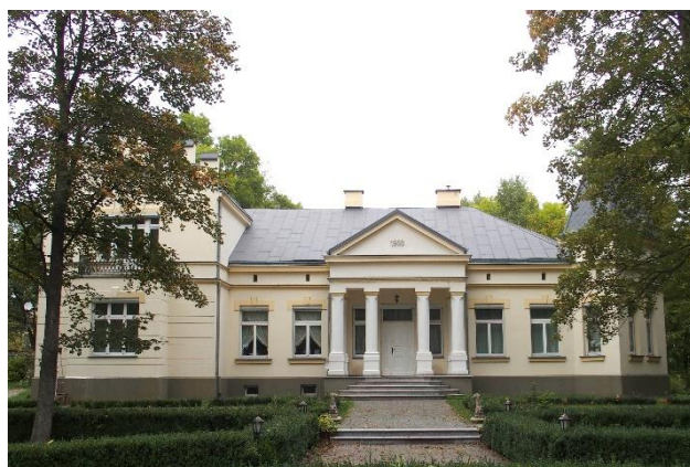
Zdjęcie nr 20. Pałacyk, Pianowo-Daczki