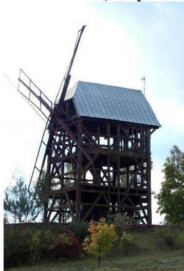
Zdjęcie nr 10. Wiatrak koźlak, Krzyczki Szumne

Wiatrak koźlak zlokalizowany w Krzyczkach Szumnych został wzniesiony 2 ćw. XIX w., według pierwotnego planu konstrukcji z XV w.. Dawniej był on kryty gontem obecnie blachodachówką. Konstrukcja drewniana, słupowo-ramowa bez pokrycia zewnętrznego. Do obecnych czasów zachowała się nie tylko konstrukcja, ale również wewnątrz w postaci drewnianych wałów i przekładni. Szkielet Wiatraka stanowią drewniane belki zarówno oryginalne jak i w części zrekonstruowane. Wszystkie oryginalne belki wymagają konserwacji lub rekonstrukcji. Wiatrak posiada zrekonstruowane drewniane skrzydła. Posiada także w pełni zachowaną pierwotną wewnętrzną konstrukcję, wraz ze znaczną większością elementów napędu oraz urządzeń przemiałowych.