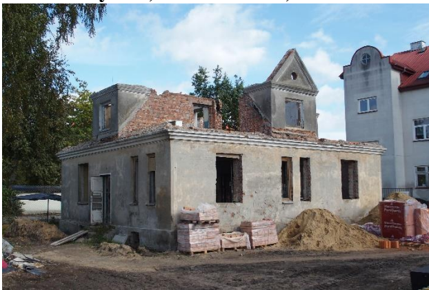
Zdjęcie nr 5. Dom nauczyciela, ul. Staszica 1A, Nasielsk (w trakcie przebudowy)