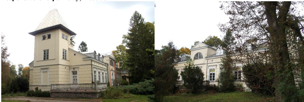
Zdjęcia nr 15, 16. Zespół dworsko-parkowy, Kosewo