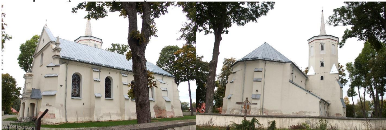
Zdjęcia nr 1, 2. Kościół parafialny św. Doroty, Ciekosyn