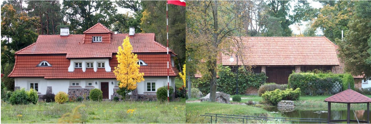
Zdjęcia nr 17, 18. Zespół dworsko-parkowy, Lelewo