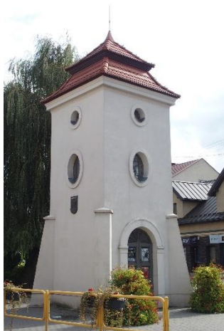
Zdjęcie nr 19. Nasielska „baszta”