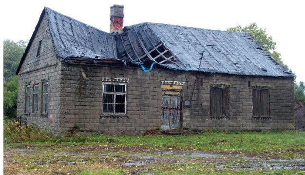
Zdjęcie nr 11. Dawny dom modlitewny, Mazewo Dworskie „A” (przed remontem)