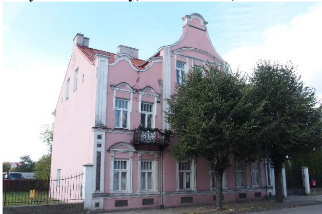
Zdjęcie nr 9. Budynek mieszkalny, ob. biblioteka, ul. Piłsudskiego 6, Nasielsk

Budynek usytuowany dawniej w zwartej zabudowie, obecnie wolnostojący. Obiekt na planie prostokąta, z płytkim, środkowym ryzalitem od wschodu i ryzalitem bocznym klatki schodowej i kwadratowym gankiem od zachodu. Bryła prosta, budynek częściowo, płytko podpiwniczony, dwukondygnacyjny, z mieszkalnym poddaszem, nakryty dachem dwuspadowym, od wschodu i zachodu dwie facjaty przekryte dachami dwuspadowymi. Ściany wzniesione z cegły. Budynek posadowiony na fundamentach kamiennych, otynkowany.