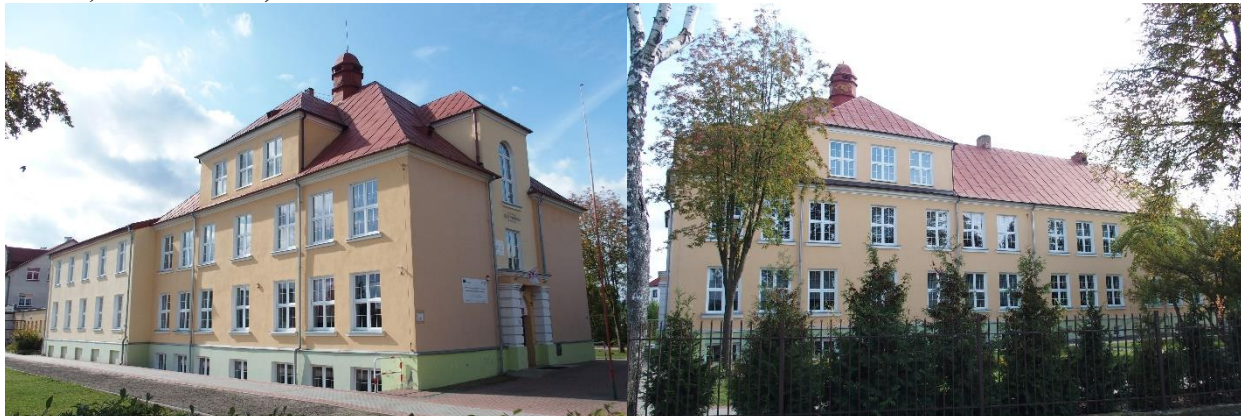
Zdjęcia nr 7, 8. Szkoła, ul. Szkolna 1, Nasielsk

Budynek szkoły usytuowany na trójkątnej działce ograniczonej od zachodu ul. Szkolną, od południa ul. Polną i od wschodu ul. Staszica.