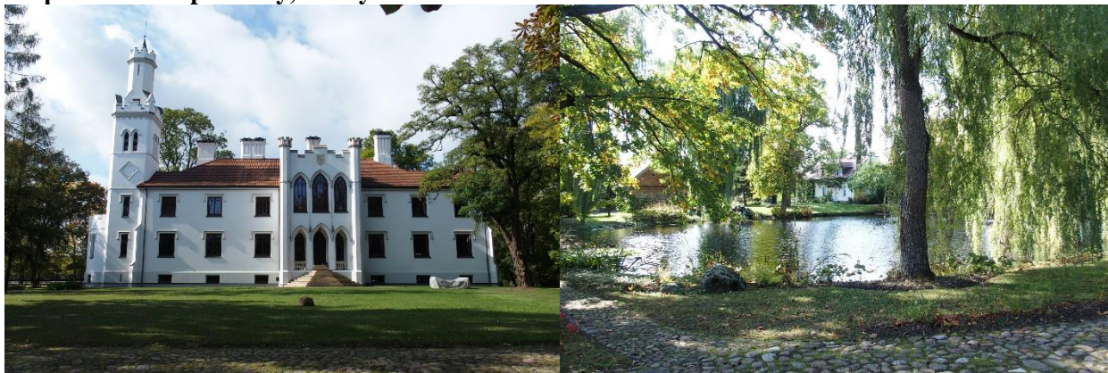
Zdjęcia nr 13, 14. Zespół dworsko-parkowy, Chrcynno

Pałac wybudowany w 1845 r. przez Józefa Koźmińskiego według projektu Henryka Marconiego. Pałac został doszczętnie zniszczony w 1945 r. przez wycofujące się wojska sowieckie. Przez kilka dekad pozostawał niezabezpieczony i ulegał dalszej destrukcji. Dopiero lata 2 tysięczne przyniosły obiektowi gruntowną renowację i przywrócenie do dawnego wyglądu według oryginalnych projektów. W 1993 r. ruiny pałacu z parkiem zostały zakupione przez prywatnego inwestora, gdzie nadal obiekt podlegał dalszej ruinie. Dopiero w latem 1999 r. zakupiony przez kolejnych inwestorów. W 2000 r. podjęta została decyzja o odbudowie pałacu, która została zakończona w 2004 r. Właściciele zrezygnowali z odbudowy przylegającego do korpusu głównego skrzydła bocznego, który to ma przypominać burzliwe losy pałacu. Pałac wraz z otoczeniem został zaadaptowany na stadninę koni.