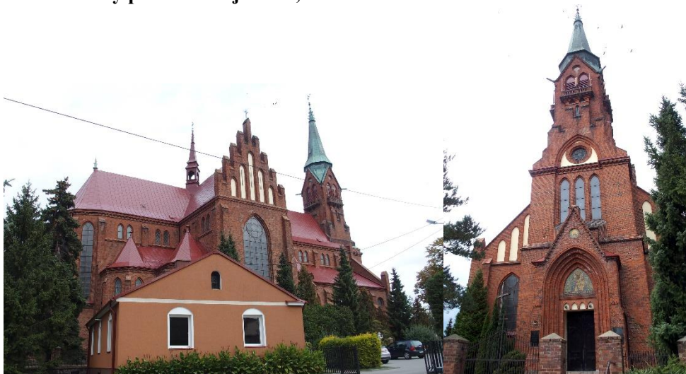
Zdjęcia nr 3, 4. Kościół farny pw. Św. Wojciecha, Nasielsk